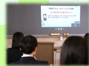
遠隔による情報モラル研修