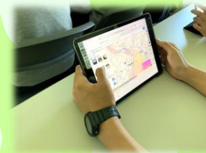
防災教室での資料共有