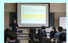
産業社会と人間（講話）