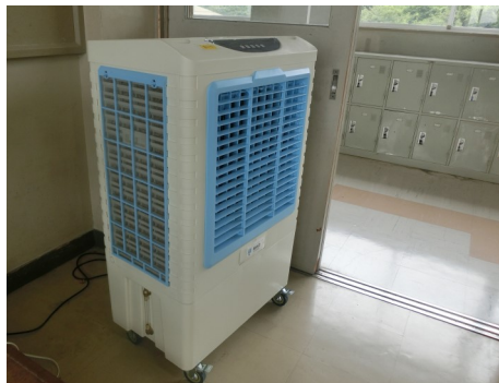
教室に設置された冷風機 (下部に水を入れて使用します)

■ 8月になって、急に暑い日が続くようになりました。学校では夏場の生徒の学習環境の充実や健康管理を意識した教育環境の整備という観点から、冷風機と冷水機を設置しました。冷風機は各教室と体育館に全部で10台、冷水機は1年生から3年生の各フロアの廊下に1台ずつ、体育館に1台、農場更衣室に1台の計5台設置されました。冷風機と冷水機を有効に活用して、厳しい暑さを乗り切りたいと思います。