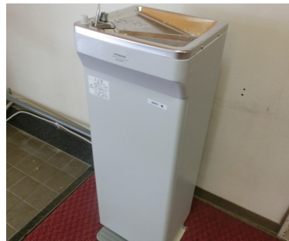
体育館入口に設置された冷水機 (高さはおよそ1メートル)