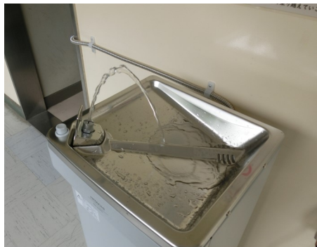
廊下に設置された冷水機 (ペダルを踏むと冷水が出ます)