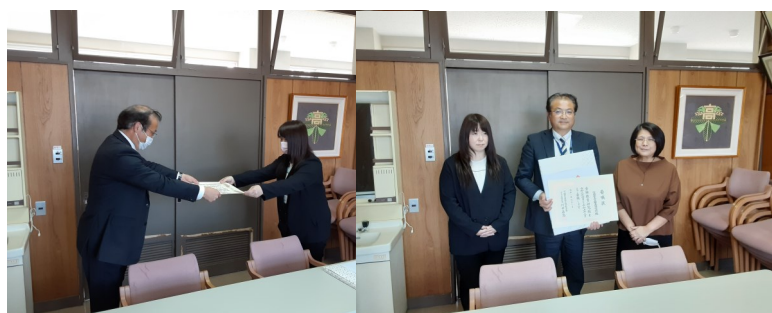
【研究校として委嘱状が授与されました】

本校では、平成28年度より福祉の授業を展開しており「介護職員初任者研修」修了認定へ向けて日々頑張っています。令和2年度も19名全員が認定試験を経て、無事に「介護職員初任者研修」の全課程を修了しました。現在はそれぞれの進路で頑張っています。