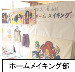
ホームメイキング部