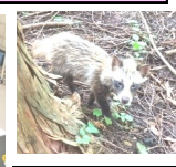
林内で観察中 子ダヌキ登場