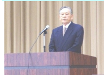
熊谷同窓会長・挨拶